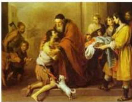
U priči o "Izgubljenom sinu".

Gdje je Isus spominjao takve prijatelje?