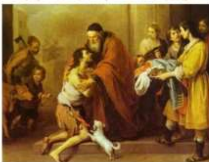
U priči o "Izgubljenom sinu".

Gdje je Isus spominjao takve prijatelje?