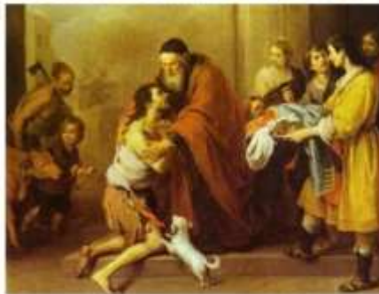
U priči o "Izgubljenom sinu".

Gdje je Isus spominjao takve prijatelje?